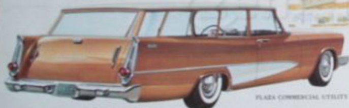
PLYMOUTH SUBURBAN EN UTILITY MODELLEN

Plymouth Commercial en Utility, 6 cil., en V-6 New Yorker Commercial Utility, 6 cil., en V-6 New Yorker Custom Suburban, 6 cil., en V-6, 2 auto's